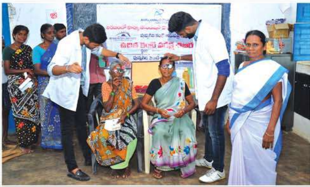
Eye testing by the doctors