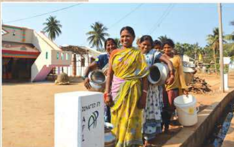
Provided water distribution pipelines