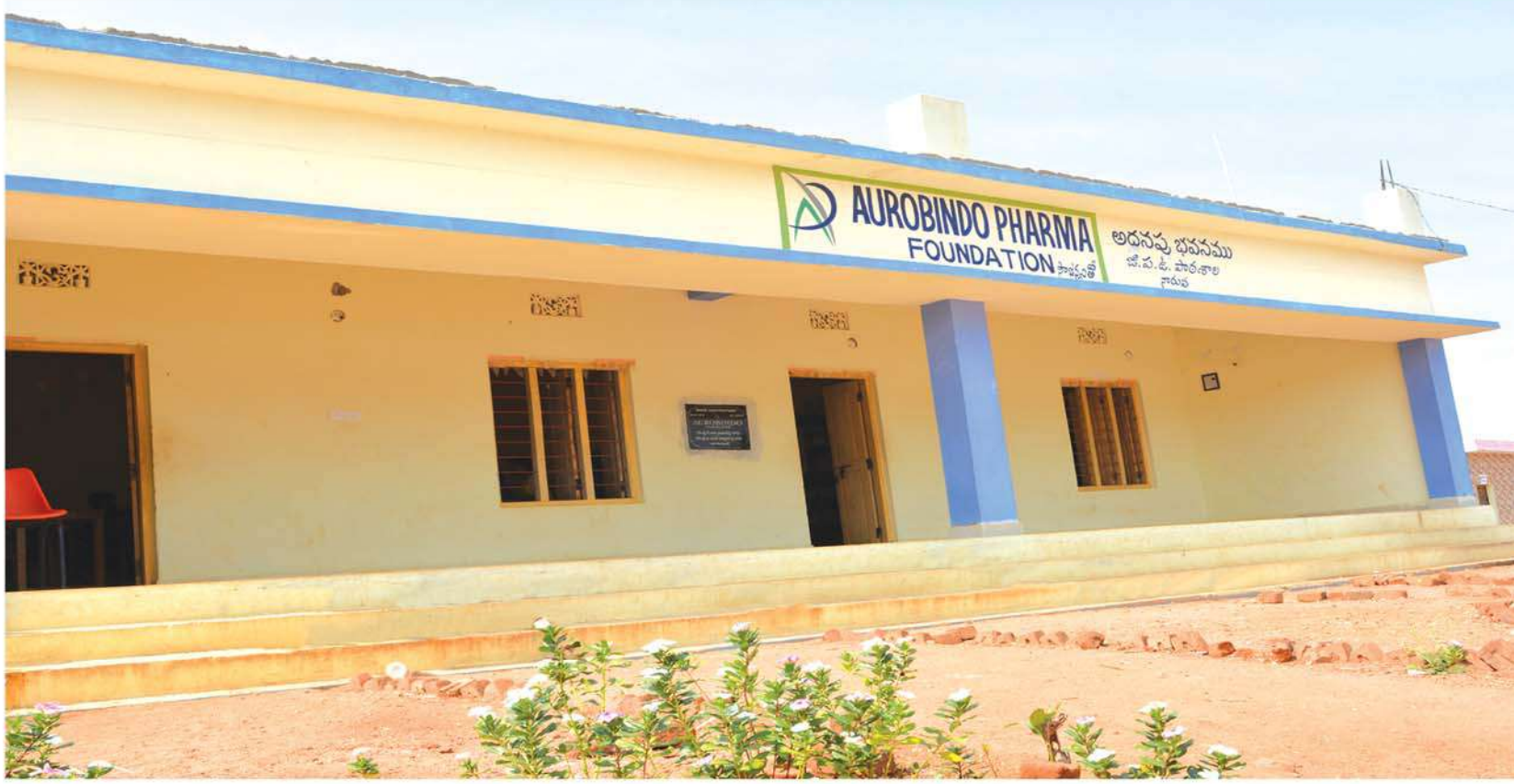
New additional classrooms at Zilla Parishad High School, Naruva