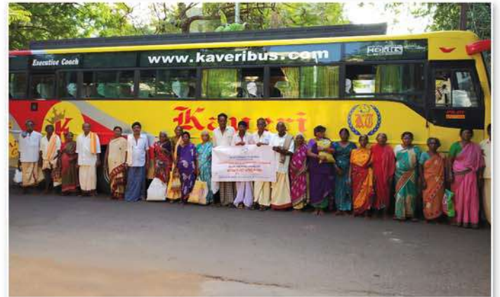
Arranged transport to patients for eye surgeries at Hyderabad