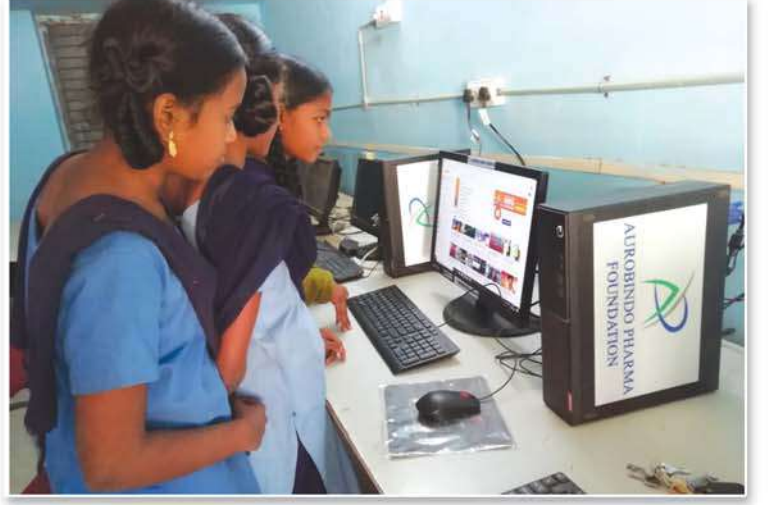
Digital classes to students