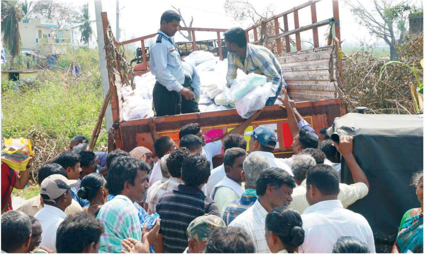
Food distribution to Titli cyclone victims