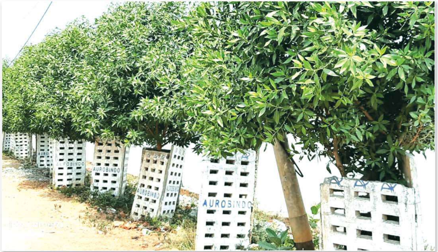
Green Colony in Visakha City