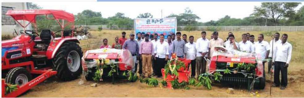
Donation of agricultural equipments to Jai Kisan Farmer Producer Organization