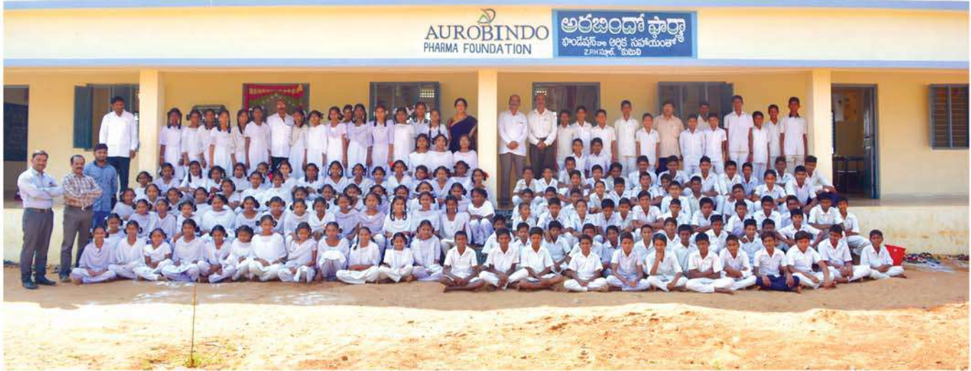
Constructed new additional class rooms of Kumili ZPH School