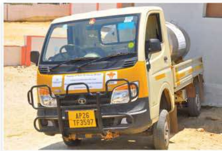
Drinking water supply to various schools and colleges