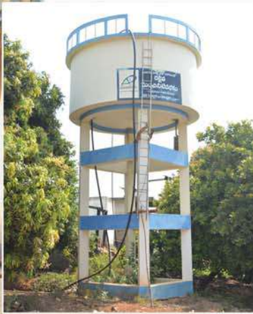
Construction of watertank