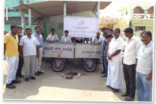
Tricycle distribution & garbage collection