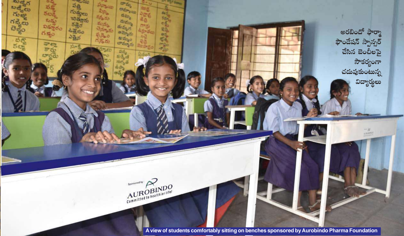
A view of students comfortably sitting on benches sponsored by Aurobindo Pharma Foundation

అరబిందో ఫార్మా ఫౌండేషన్ స్పాన్సర్ చేసిన బెంచీలపై సౌకర్యంగా చదువుకుంటున్న విద్యార్థులు