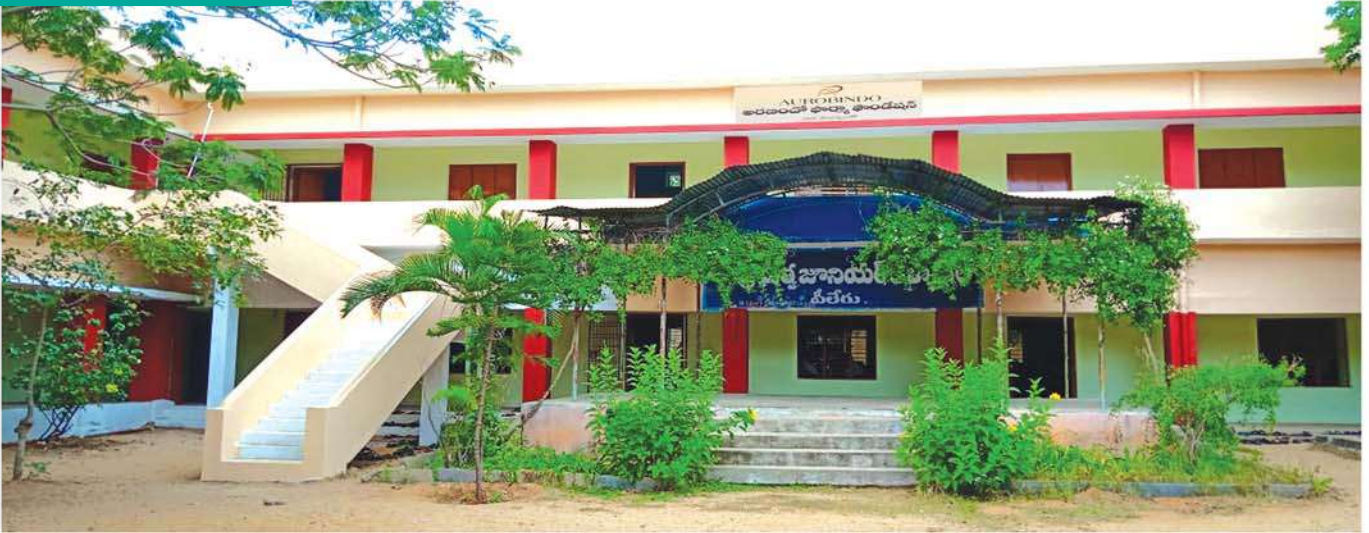
Government Junior College, Piler