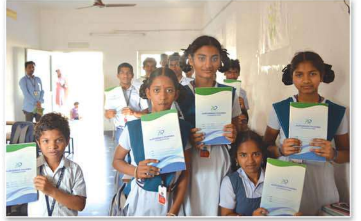
Distributed free note books