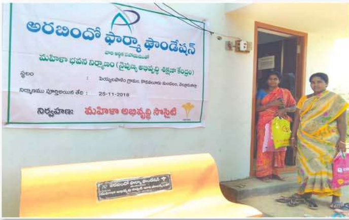
Skill Development Centre