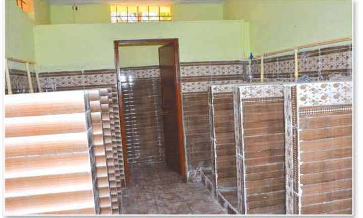
Construction of Toilet blocks for boys and girls