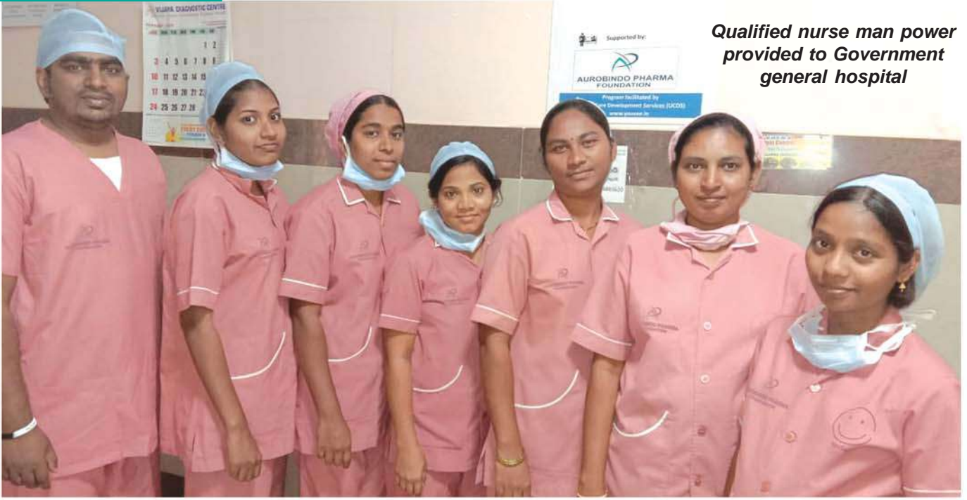
Qualified nurse man power provided to Government general hospital