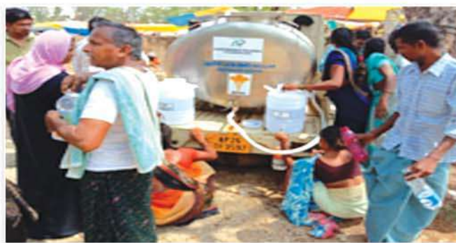
Drinking water supply to villagers

Aurobindo Pharma Foundation has provided financial support to MAS an NGOs towards establishing Farmer Service Center at Piler, Chittor district, Andhra Pradesh state. This center will provide vide range of services to farming communities in and around 18 villages of Piler.