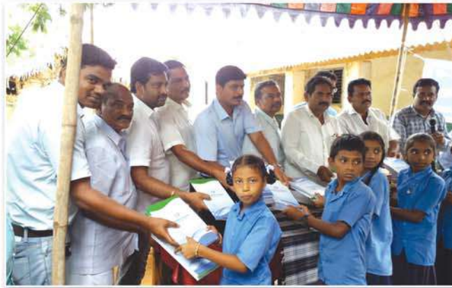
Distribution of note books