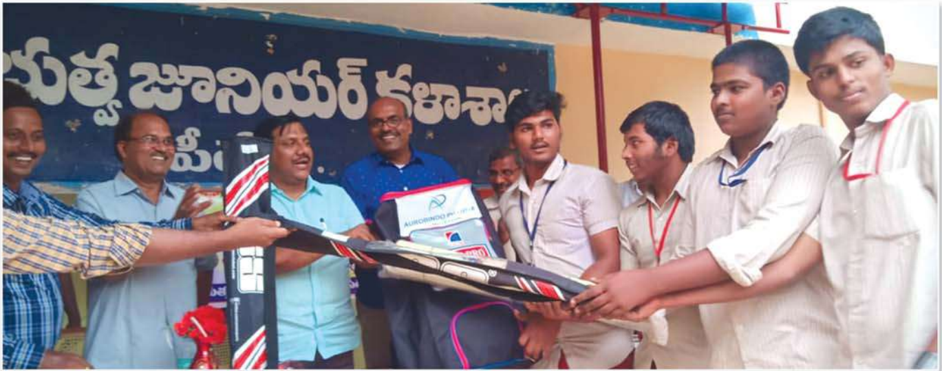
Sports Kits distribution