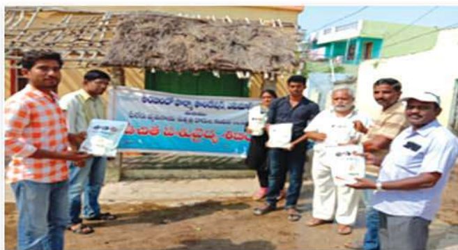
Free awareness camp on cattles diseases