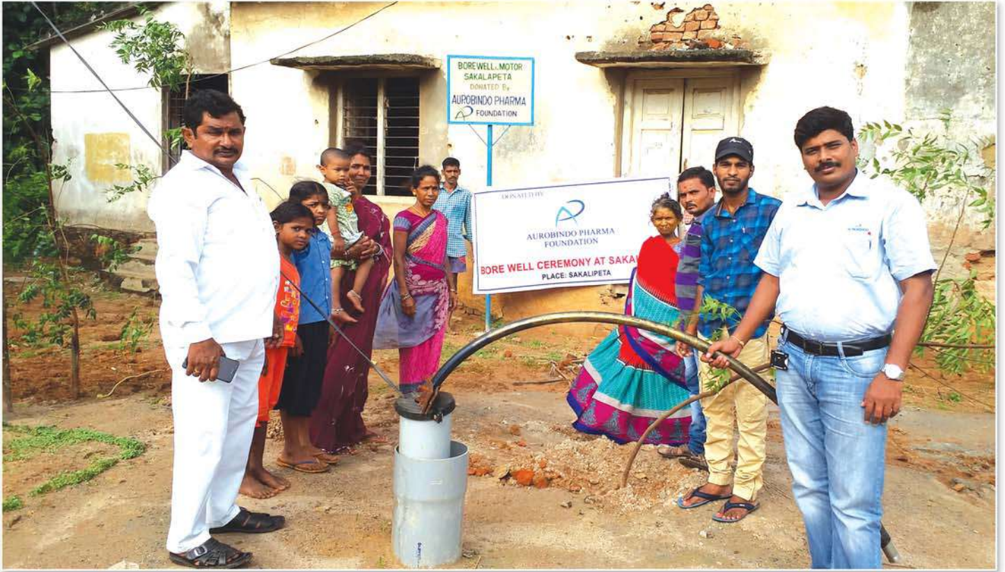
Dug borewell at Chakalipeta village