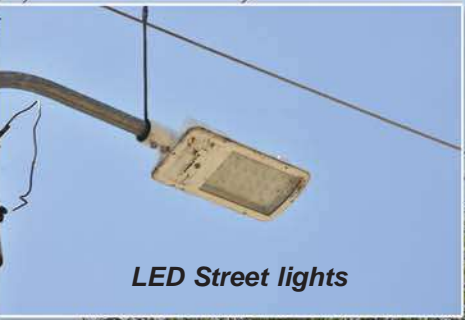
LED Street lights