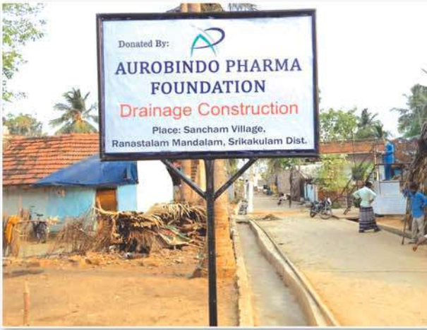
సంచాం గ్రామం, శ్రీకాకుళం జిల్లా నందు డ్రైనేజ్ ఏర్పాటు