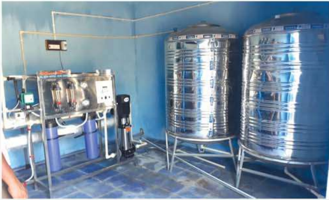
Established RO water plant at Gollavuru village, Srikakulam district