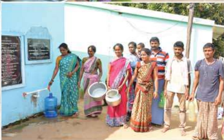
Free supply of RO water to villagers