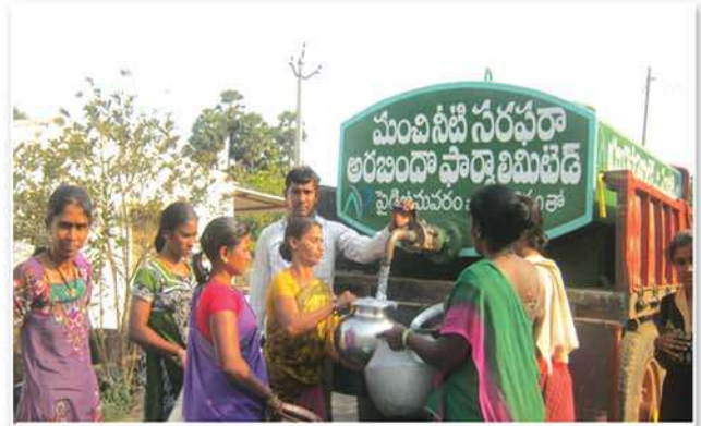
Drinking water supply through water tanker