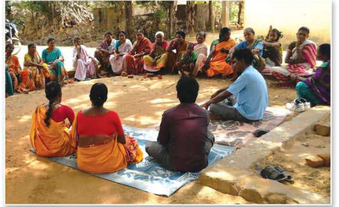
Farmers Producer Organisation Meeting