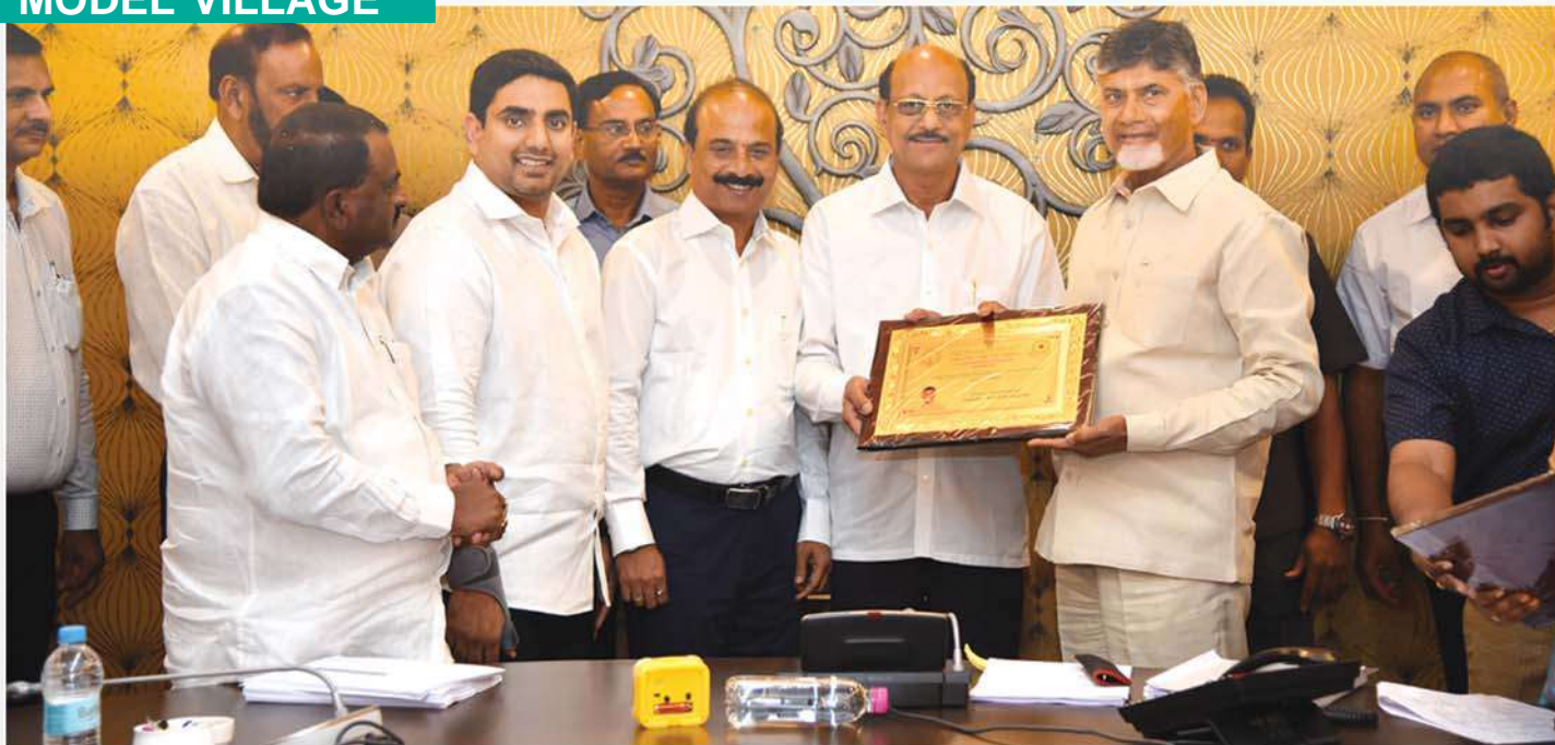
Aurobindo Pharma Foundation has received Award for State Level Best Partner under the "Smart village Smart Ward" Programme from Chief Minister of Andhra Pradesh.