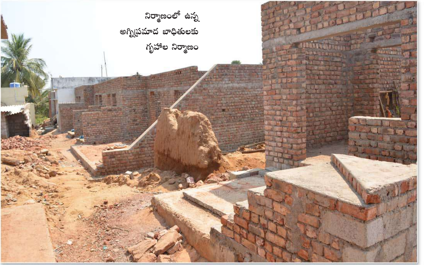
నిర్మాణంలో ఉన్న అగ్నిప్రమాద బాధితులకు గృహాల నిర్మాణం