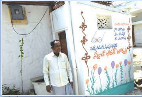
Individual household toilets