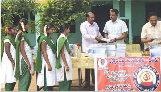
Distribution of note books to various Government Schools in Piler Mandal, Chittoor District, A.P.