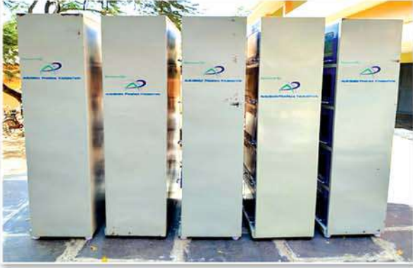
Iron racks for Library