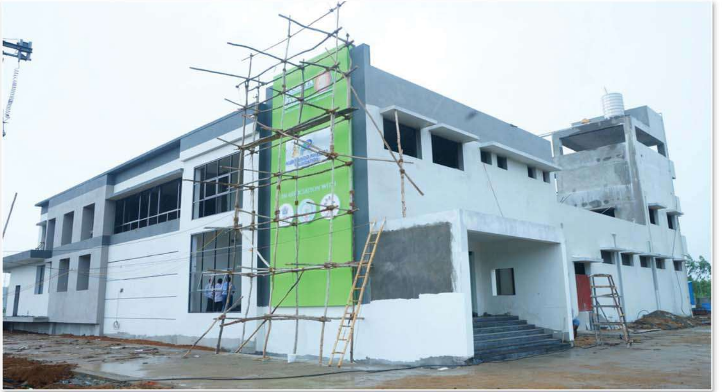
Construction of Kitchen work in progress, Srikakulam District