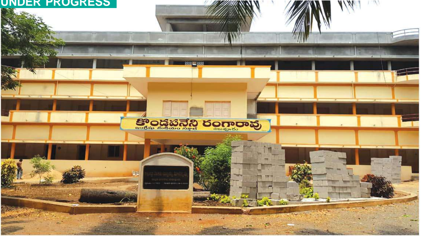
Additional class rooms to Government High School at Chiluvuru, Guntur District