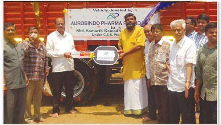
Provided Big Eicher Vehicle