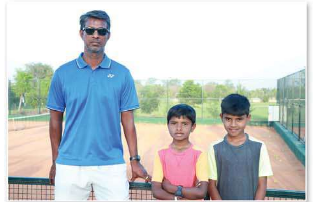
Coaching for poor sports persons