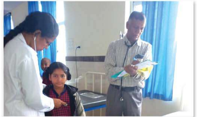
Medical camp for students