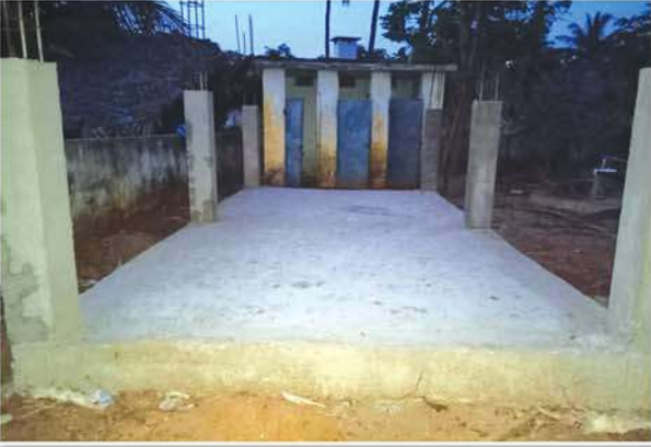
Construction of Toilet Block at Neelampeta Government High School