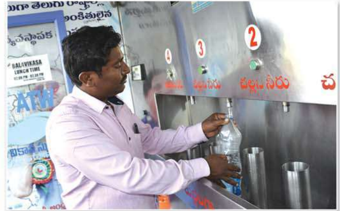
ATW center at Siddipet bustand