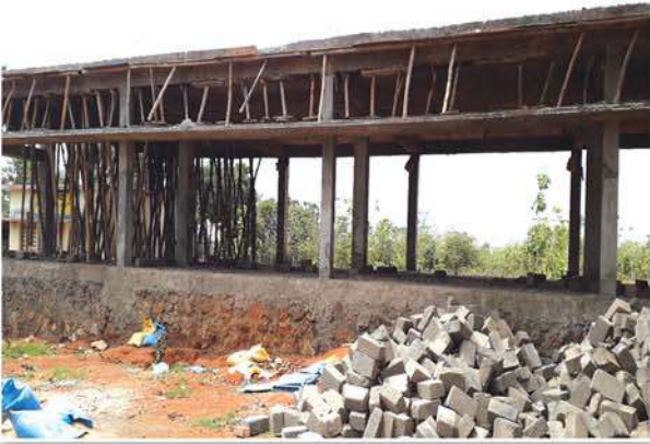
Construction of Additional Classrooms at Vempada Government High School