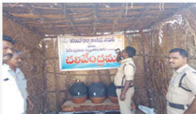
Provided drinking water facility during summer