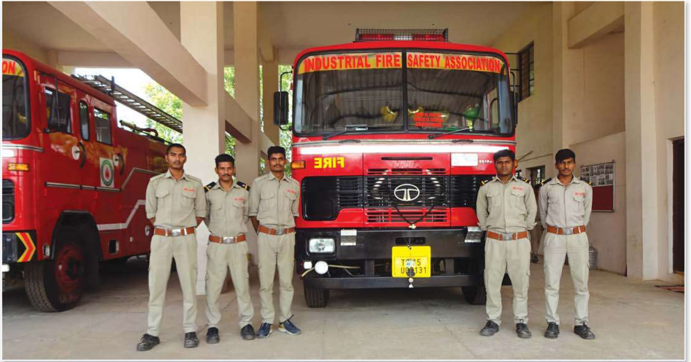
Provided Fire Tenders