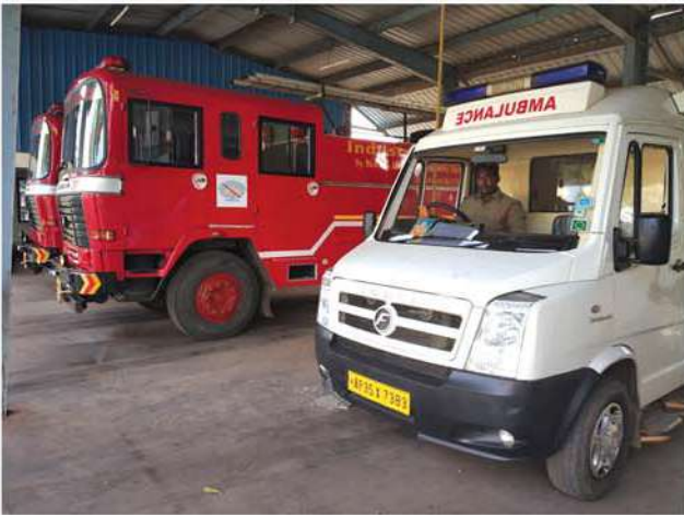
Provided Shed for vehicles