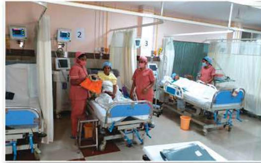
Provided well advanced equipment for RICU