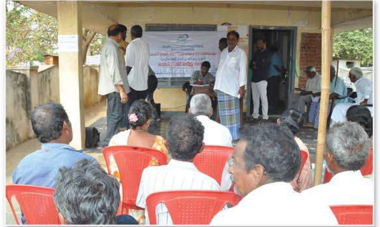
Eye testing and Enrollment