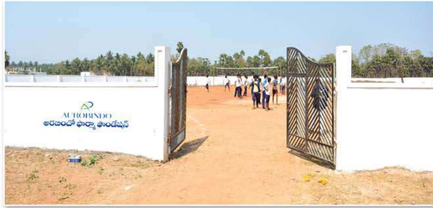
Compound wall constructed to school playground