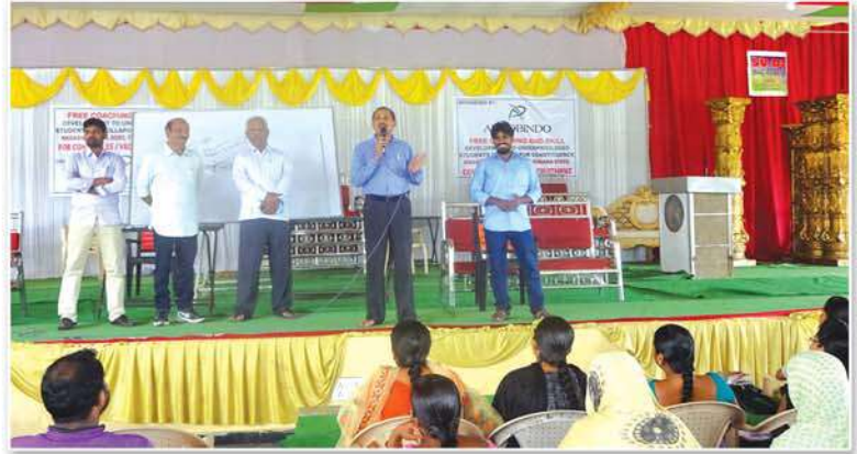
Students attending coaching classes