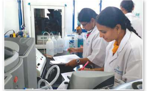
Practical Session lab