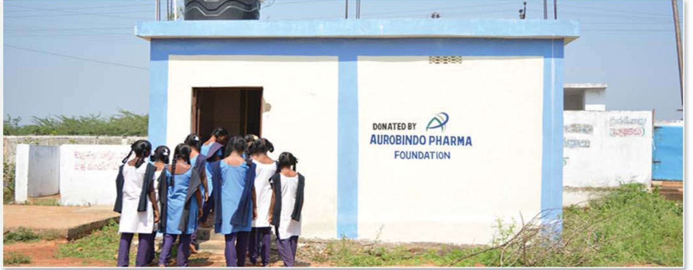
బాలికలకు ప్రత్యేకంగా ప్రభుత్వ పాఠశాలల్లో టాయిలెట్లు ఏర్పాటు

Aurobindo Pharma Foundation has constructed toilets blocks to students of variuos Government schools of Pydibhimavaram, Gollvuru and Govindapuram in vizianagaram and Srikakulam districts. From these facilities 1230 students are benefitted.