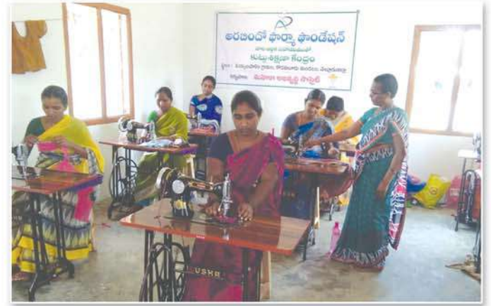
Women Attending Tailoring Classes

ఆంధ్రప్రదేశ్, నెల్లూరు జిల్లా, కొడవలూరు మండలంలోని పెయ్యలపాలెం గ్రామాన్ని అరబిందో ఫార్మా ఫౌండేషన్ దత్తత తీసుకున్నారు. అక్కడ అభివృద్ధి కార్యక్రమాల కోసం 'మూస్' స్వచ్ఛంద సంస్థ సహకారంతో, అనేక కార్యక్రమాలు అమలు చేయించారు. ఈ కృషి వల్ల అరబిందో ఫార్మా ఫౌండేషన్, రాష్ట్ర స్థాయిలో స్టార్ట్ గ్రామం-స్టార్ట్ అవార్డు పథకంలో ఉత్తమ భాగస్వామి అవార్డును 2019 జనవరి 28న నాటి ముఖ్యమంత్రి చేతుల మీదుగా అందుకుంది.