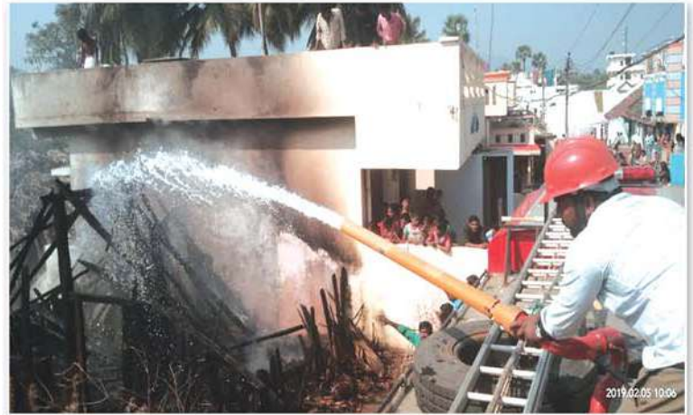
Attended Fire Mishap