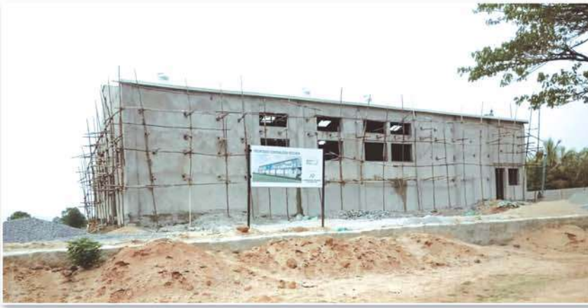
Construction of Kitchen work in progress