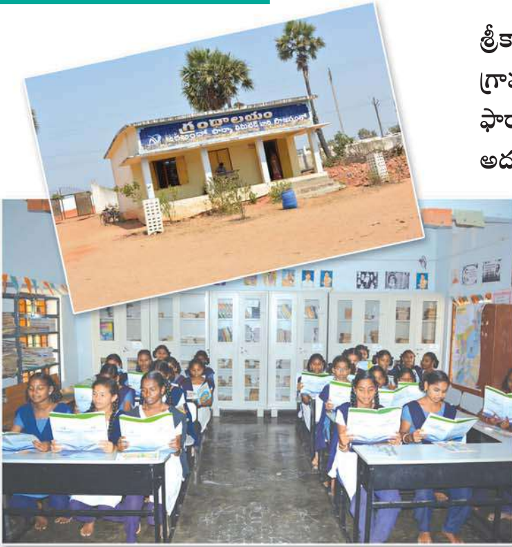
Amenities provided to school library

శ్రీకాకుళం జిల్లా, రణస్థలం మండలం పైడిభీమవరం గ్రామ ప్రభుత్వ జిల్లా పరిషత్ హైస్కూల్‌కి అరబిందో ఫార్మా ఫౌండేషన్ సామాజిక బాధ్యతగా కల్పించిన అదనపు సౌకర్యాలు