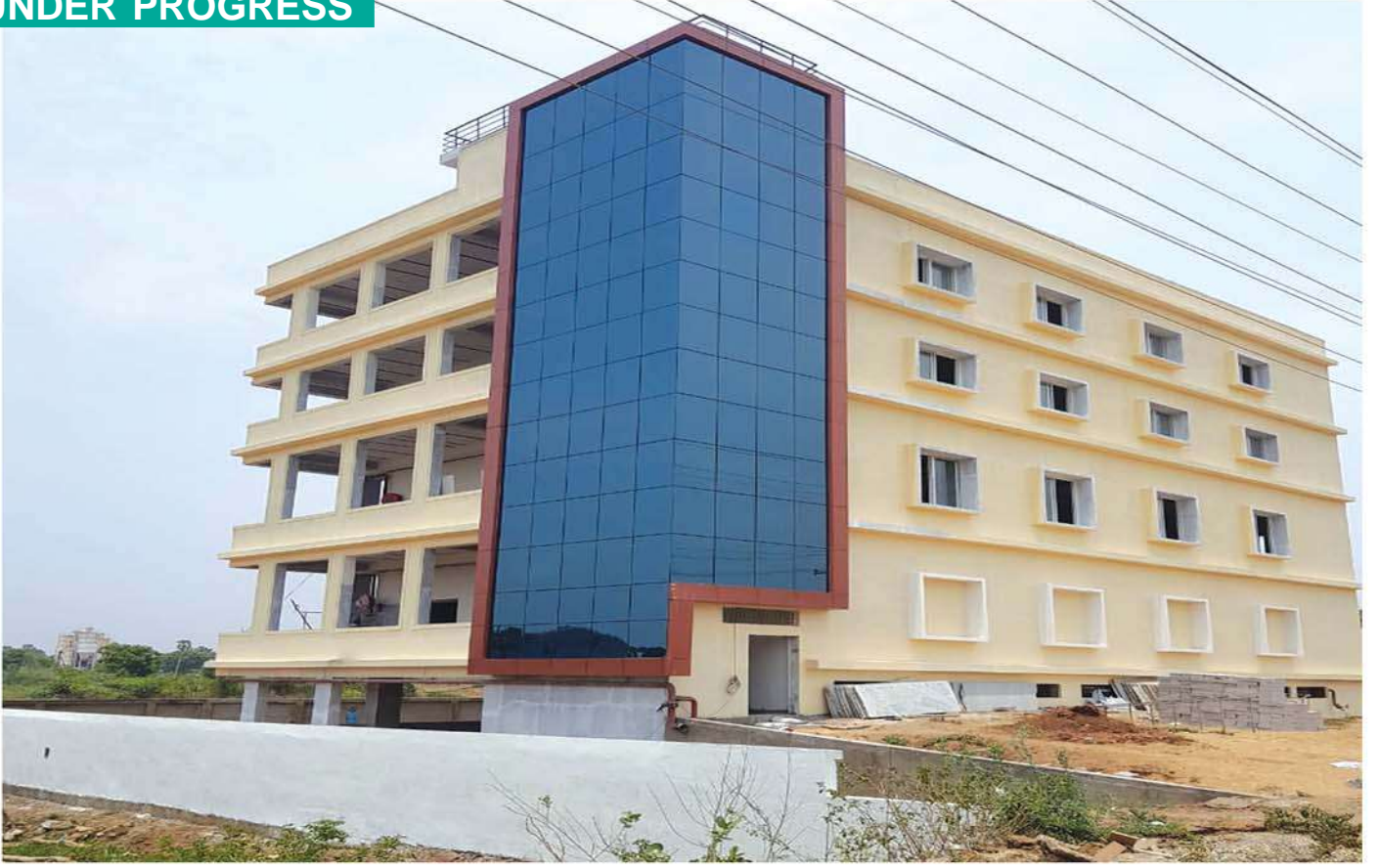
Skill Development Centre at Vaddeswaram village in Tadepalle mandal, Guntur district.