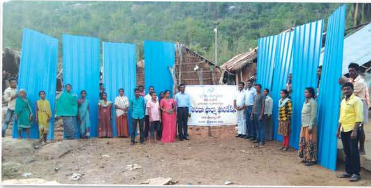
Galvanised Iron Sheets distribution