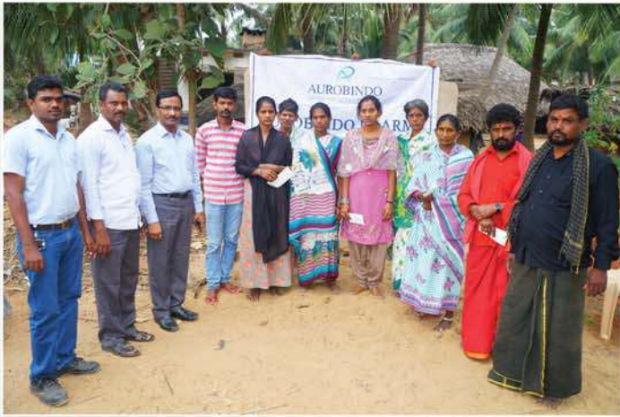
Financial support to Fire Mishap families