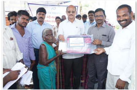
Minimum needs kit distribution