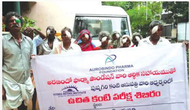
Patients after eye surgeries