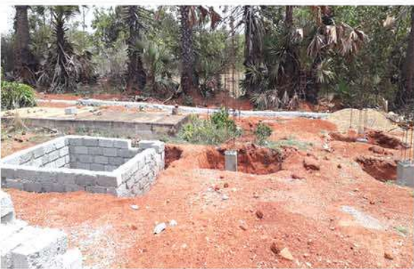
Construction of Toilet Block at Vempada Government High School