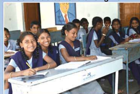
Provided dual desks

Aurobindo Pharma Foundation has adopted Borapatla Village in Hatnoora Mandal, Sangareddy District, Telangana State. And various development activities are being carried out through an NGO "MAS". Recently it has established Jai Kisan Farmer Producer Organization & Custom Hiring Center for the small & marginal farmers. Agricultural equipments are made available to farmers on Hire at low rates. Agricultural equipments like... Mahindra Tractor, Hay baler, Dozer, Tractor operated Plough, Rotavator and other agricultural inputs have been provided to these poor farmers. About 1500 farmers from Borapatla, Reddykhanapur and other surrounding villages are mobilized into this Farmer Producer Organization.