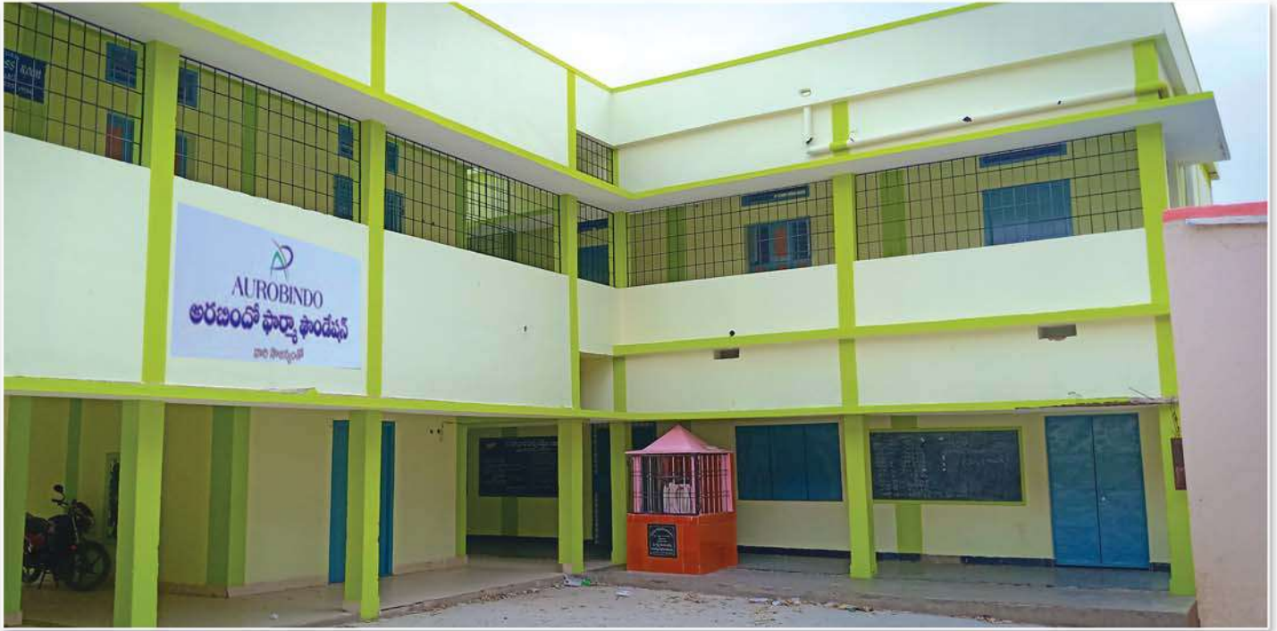
Renovation and painting to school building at ZPH school, Piler

పీలేరు జిల్లా పరిషత్ ఉన్నతపాఠశాల భవనానికి రంగులు మరియు నవనీకరణ