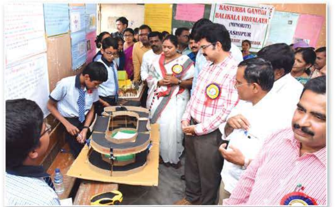
Students showing their exhibits at Science exhibition