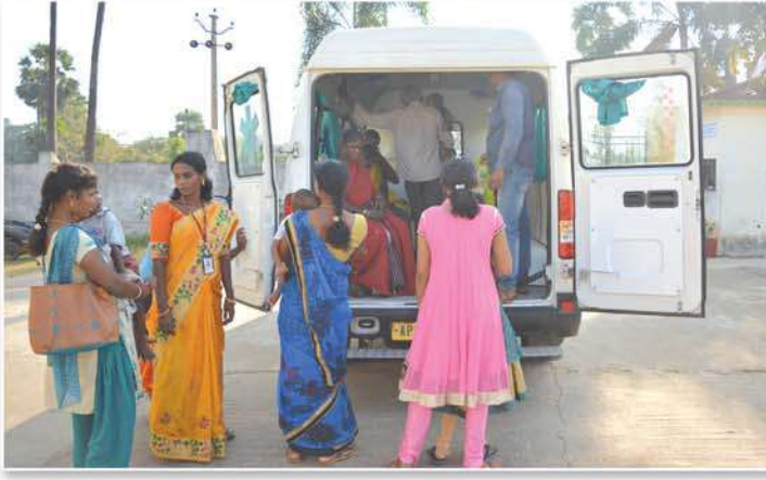
Services of provided Ambulance