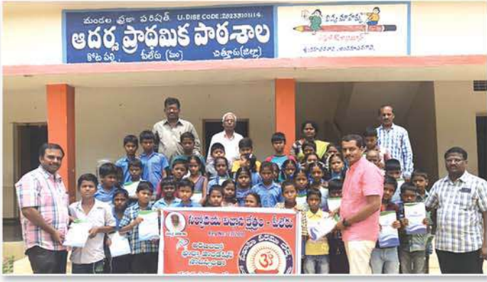
Distribution of note books to various Government Schools in Piler Mandal, Chittoor District, A.P.