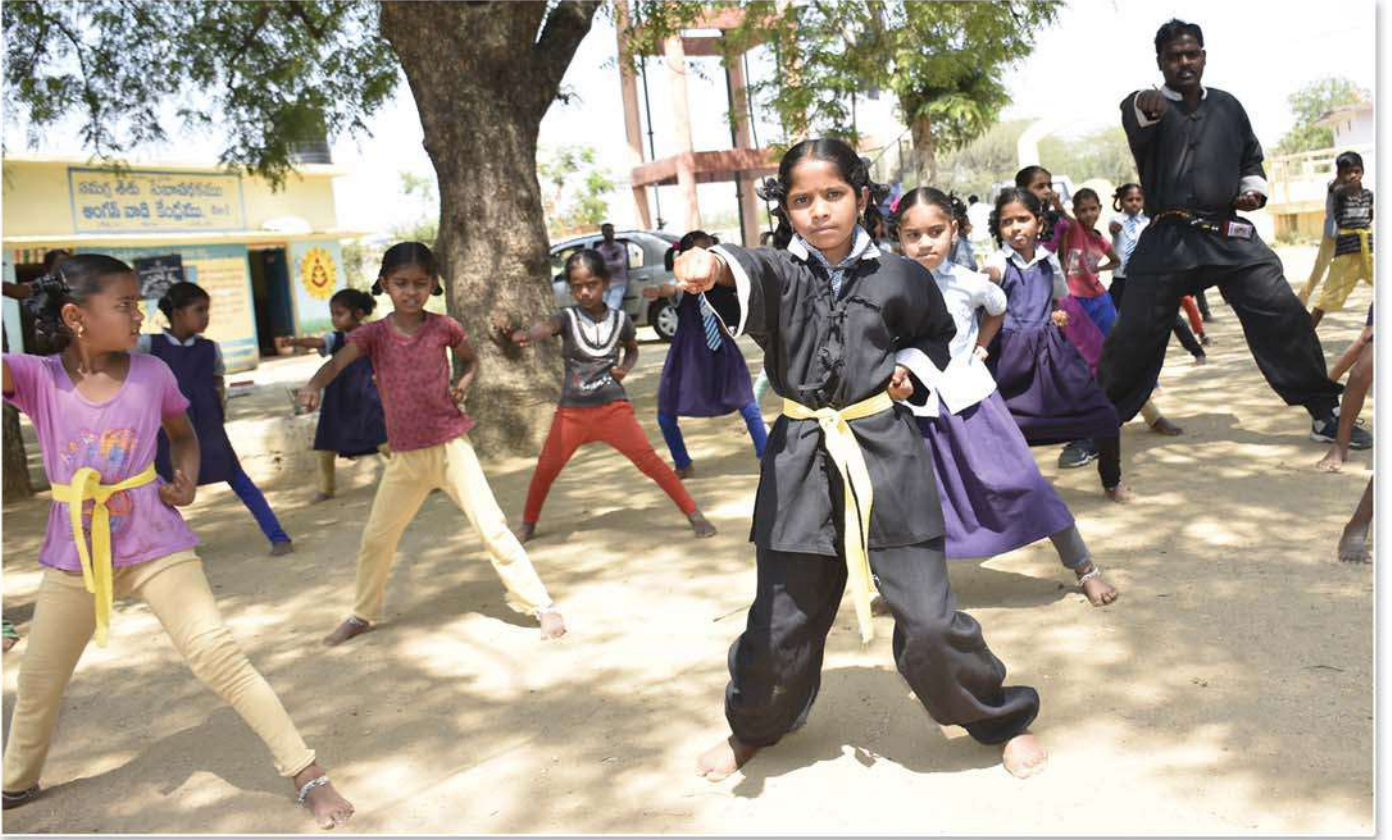
Students attending Karate classes