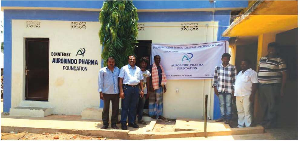
శ్రీకాకుళం, విజయనగరం జిల్లాల్లోని ప్రభుత్వ పాఠశాలల్లో ఏర్పాటుచేసిన టాయిలెట్లు