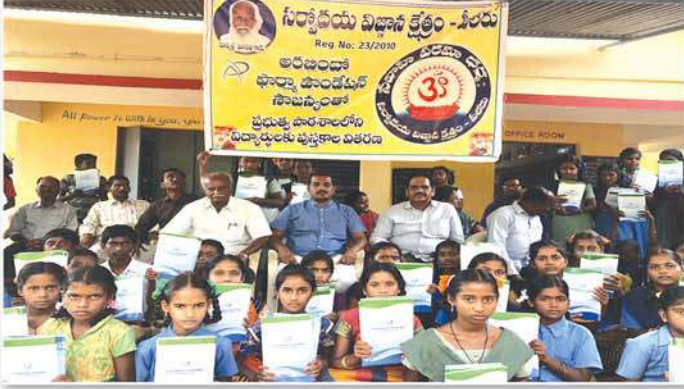
Distribution of note books to various Government Schools in Piler Mandal, Chittoor District, A.P.