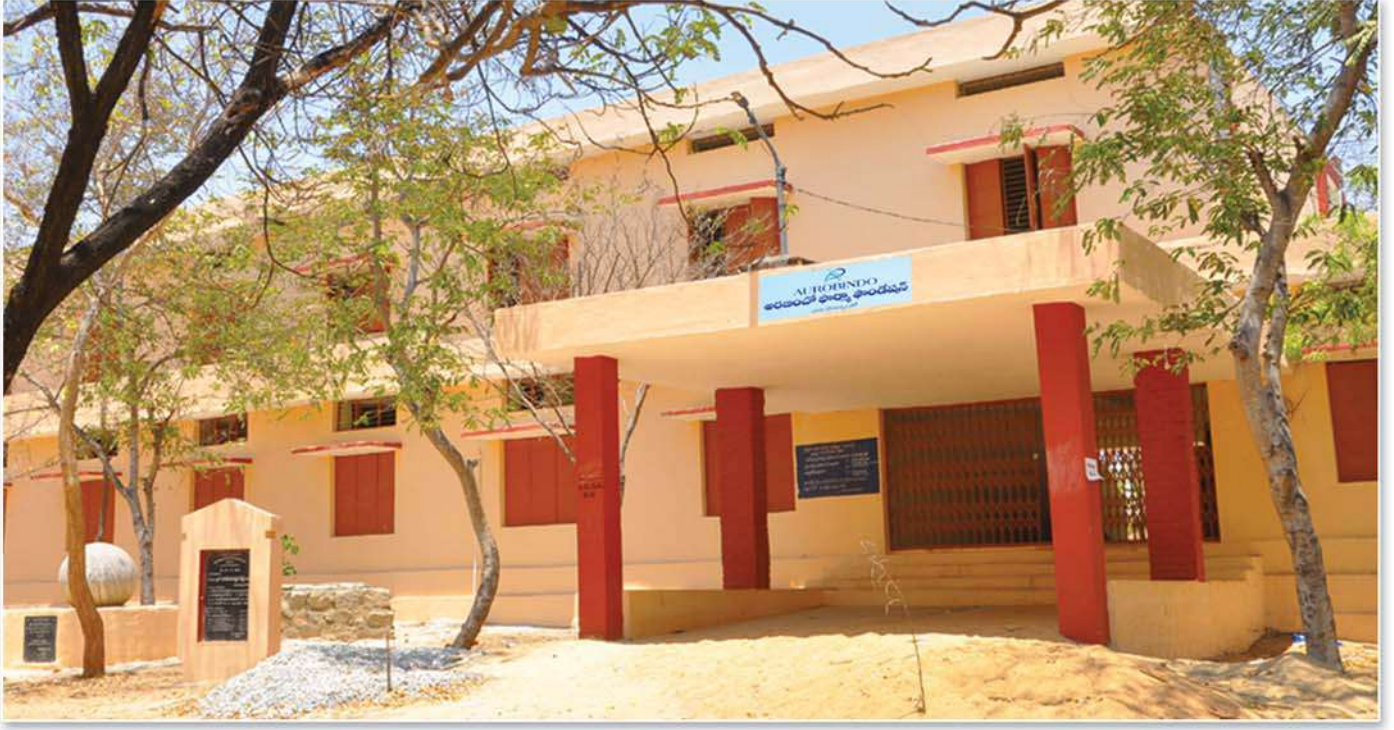
Renovation of Govt. Junior College