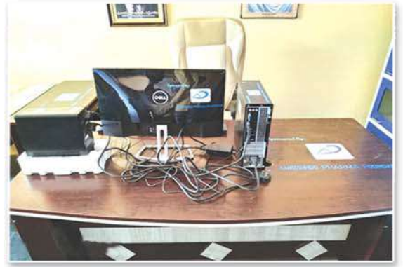
Provided computer and colour printer