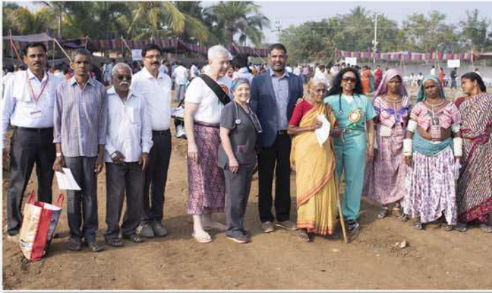
Distributing medicines at camp