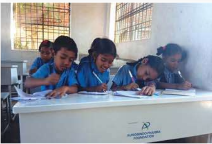
Dual desks distributed