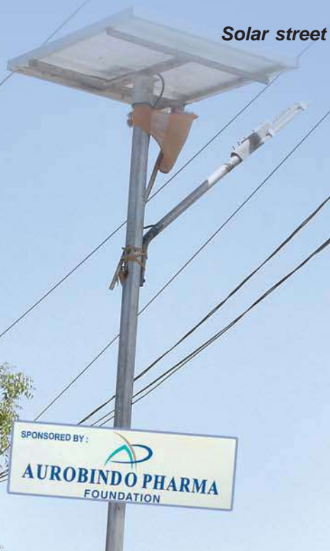
Solar street lights

తెలంగాణ రాష్ట్రంలో, సంగారెడ్డి జిల్లా హత్తుర మండలంలో, బోరపల్ల గ్రామంలో అనేక అభివృద్ధి కార్యక్రమాల కోసం అరబిందో ఫార్మా ఫౌండేషన్ కృషి చేసింది. ఈ గ్రామాన్ని దత్తత తీసుకున్న అరబిందో ఫార్మా ఫౌండేషన్, 'మాస్' అనే స్వచ్ఛంద సంస్థ ద్వారా అనేక సామాజిక కార్యక్రమాలు చేయించింది. ఈమధ్య కాలంలో జైకిసాన్ ఫార్మర్ ప్రొడ్యూసర్ ఆర్గనైజేషన్ & కష్టమ్ హైరింగ్ సెంటర్ స్థాపించబడినది. దీని ద్వారా పేద మరియు సన్నకారు రైతులకు వ్యవసాయ పనిముట్లు తక్కువ ధరలకు అద్దెకు ఇస్తున్నారు. దీనిలో భాగంగా 1500 మంది రైతులకు ట్రాక్టర్, హేబేలర్, డోజర్, ప్యాడీ ట్రాన్స్‌ప్లాంటర్, కల్టివేటర్ మొదలగు పరికరాలను అందుబాటులో ఉంచారు. ప్రస్తుతం ఎత్తిపోతల పథకం ద్వారా సుమారు 1,125 ఎకరాల భూమికి సాగునీరు అందించడంతో, 1,220 చిన్న, సన్నకారు రైతులకు లబ్ధిజరిగింది.