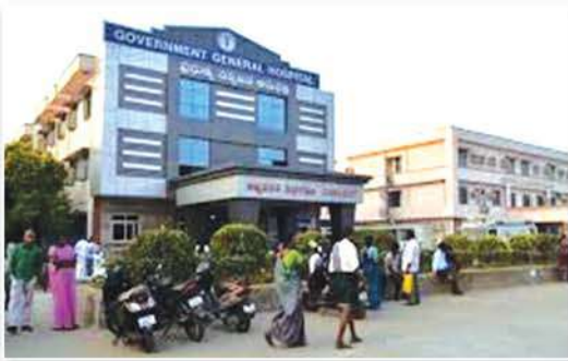
Government General Hospital (GGH), Vijayawada