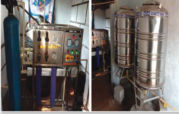
Installation of 500 LPH RO water plant at Chillapeta Yerravaram village