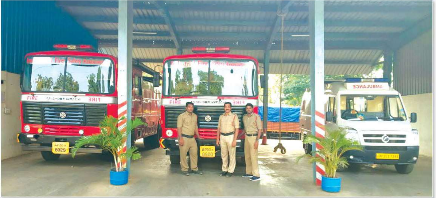
Provided Fire Tenders, Ambulance and Manpower