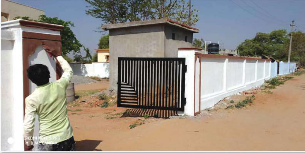
Compound wall construction