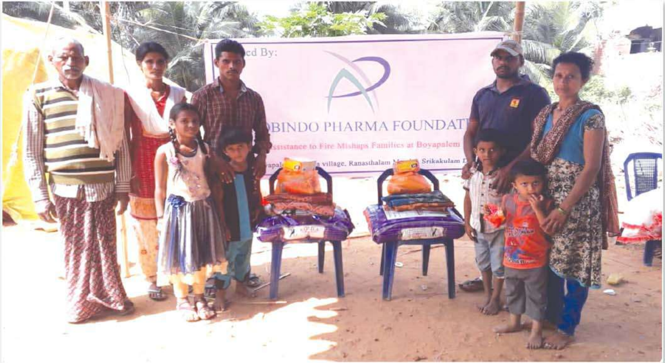
Provisions support to Fire Mishap families