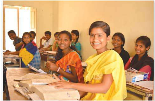
Donated benches to the students