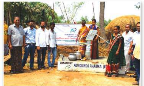
Construction of borewell