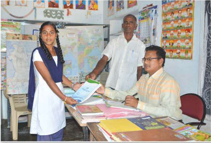
Note books distribution to students