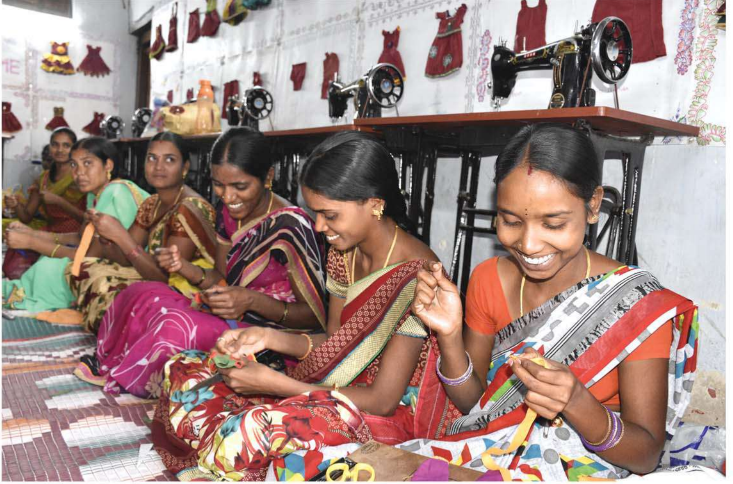
Women attending tailoring classes