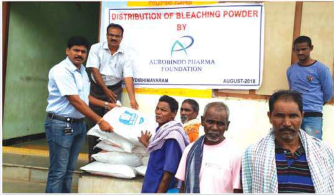
Bleaching powder distribution in raining season