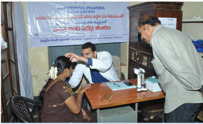
Eye testing by specialist doctors