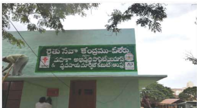
Establishment of Farmer Service Center